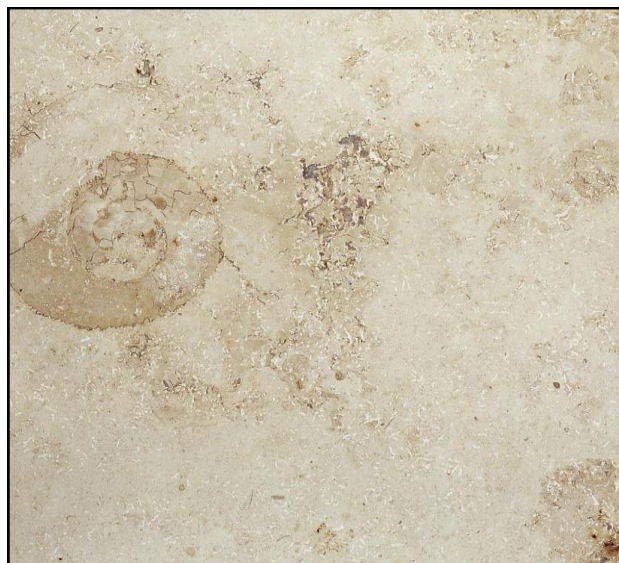
La photo est indicatif, la couleur et la structure peut dévier.

Le Jura Beige est très sensible à l'humidité (formation de taches du type I, voir NIT 213 du CSTC. Détérioration, voir pag. 14, remarques) + taches de rouille par oxydation de pyrite.